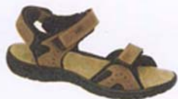
neu - die Sandalen von Loma. Seite 4