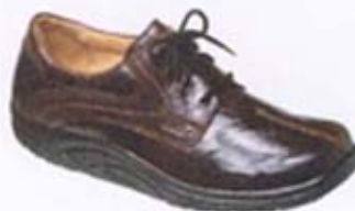
Ganter aktiv Seite 16