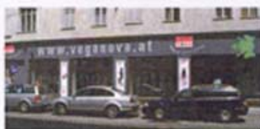
Vega Nova Wien 7 geöffnet seit September 2008 Seite 12