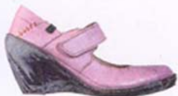
eingetroffen - die neuen von El Naturalista Seite 6