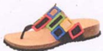
Think! ist heuer sehr bunt Seite 10